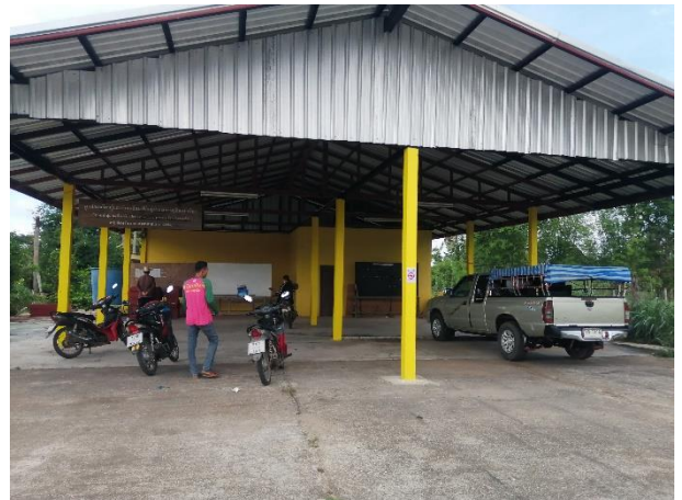
ศาลากลางบ้านมะค่าปทุม ม.๖