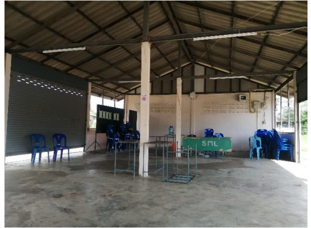
ศาลากลางบ้านสองพี่น้อง ม.๕